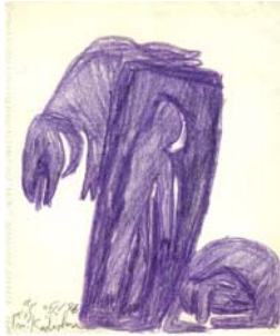
Berliner Kabinett Zeichnungen XI Bildhauerzeichnungen